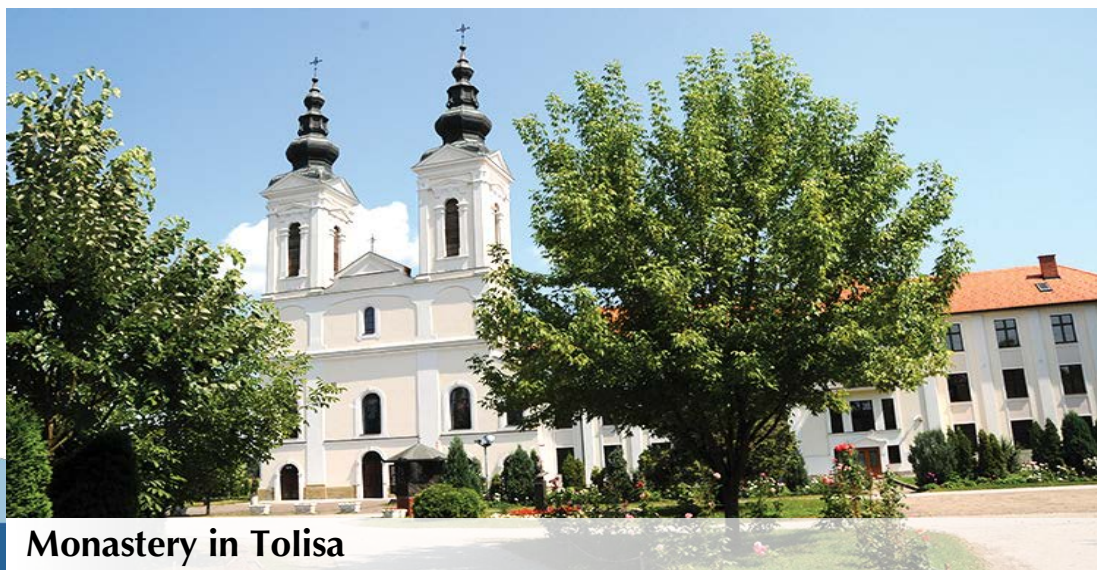
Monastery in Tolisa

It is apparent from the above that Municipality of Orašje is rich in recognized events, which represents a great advantage in the context of tourism and economy development.