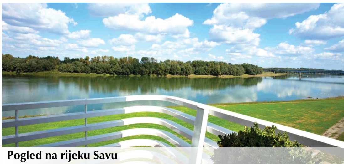
Pogled na rijeku Savu

Najveća crkva u Bosni i Hercegovini u sklopu samostana Tolise je također vrijedan resurs i može postati nezaobilazna točka posjeta za turiste. Muzej u samostanu Tolisa s vrijednim zbirkama veliki je potencijal za razvoj kulturnog turizma i povrh toga gotovo spreman za tržište.