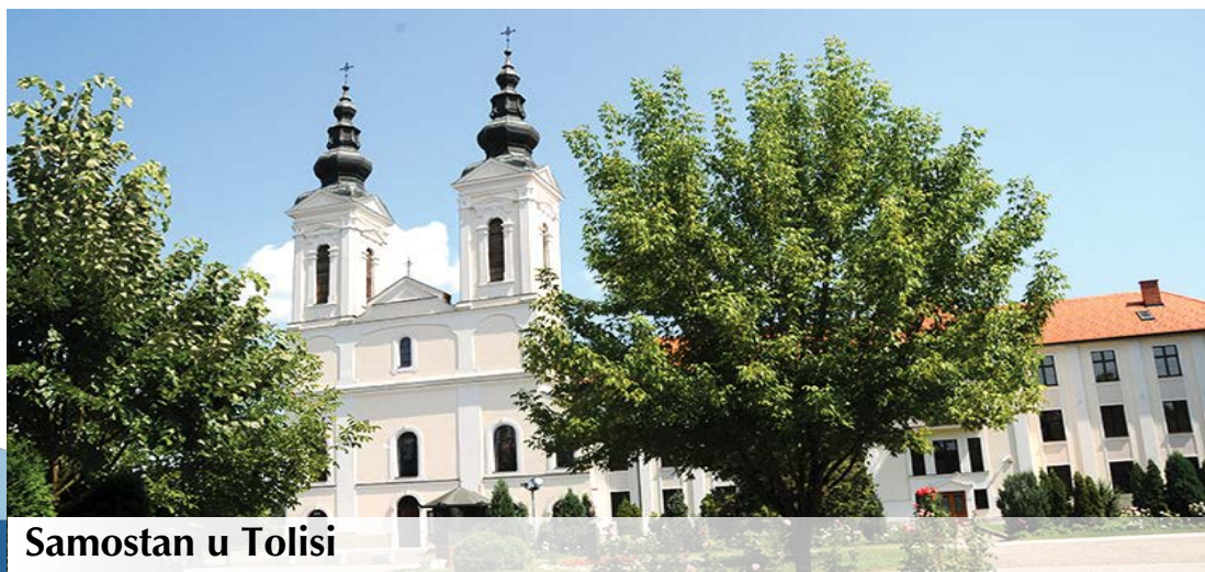
Samostan u Tolisi

Iz navedenoga je vidljivo da je Općina Orašje bogata priznatim manifestacijama što predstavlja u kontekstu razvoja turizma i gospodarstva veliku prednost.