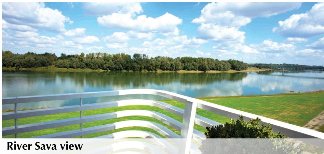
River Sava view

The largest church in Bosnia and Herzegovina within the Tolisa Monastery is also