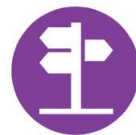
PA3 Tourism and cultural heritage