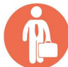
PA1 Social and health services

Osim programskog logotipa, u okviru komunikacijskih alata preporučljivo je korištenje i jednu od sljedećih tematskih ikona koje simboliziraju prioritetnu os pojedinog projekta: